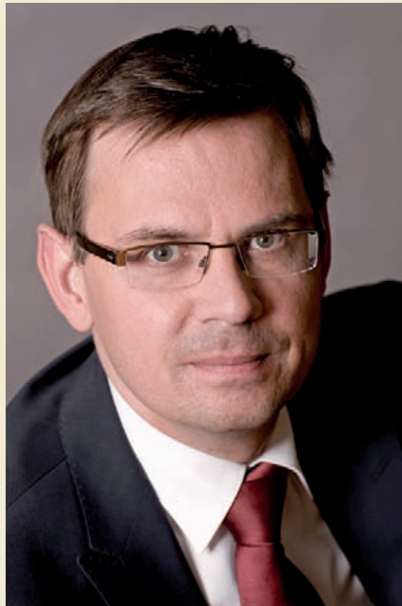
De eerste minister van Jeugd en Gezin André Rouvoet