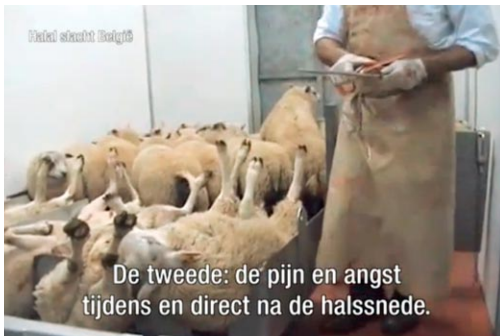
Fragment uit het filmpje tegen ritueel slachten

Bij de meer serieuze zaak van de Arabische revolutie spelen de nieuwe media een cruciale rol. Via deze media kan men elkaar vinden, van gedachten wisselen, tijdstip en plaats van samenkomst bepalen en vooral nog aanpassen. Hierbij kan