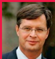
Jan Peter Balkenende