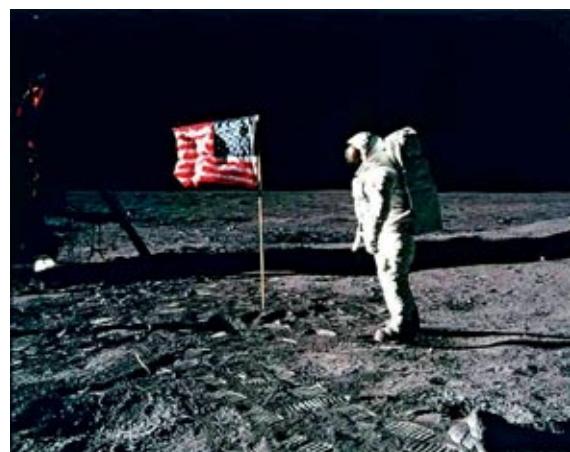
Eerste man op de maan of in Hollywood?

Het is ook voor de leerlingen duidelijk dat het hier om complottheorieën gaat. Over hun waarheids- of waarschijnlijkheidsgehalte verschillen de meningen. Bedenk dat, indien ze ( illuminaten , buitenaardse wezens, of wat dies meer zij) inderdaad zo goed zijn in mind control , zij dus ook wel eens degenen kunnen zijn die ons dergelijke complottheorieën inblazen... Overigens schijnt het permanent dragen van een hoedje van alumi-