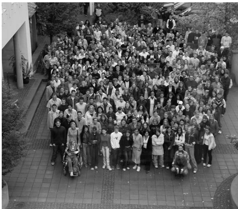
Legt u de nadruk op actieve participatie in de schoolomgeving of daarbuiten?