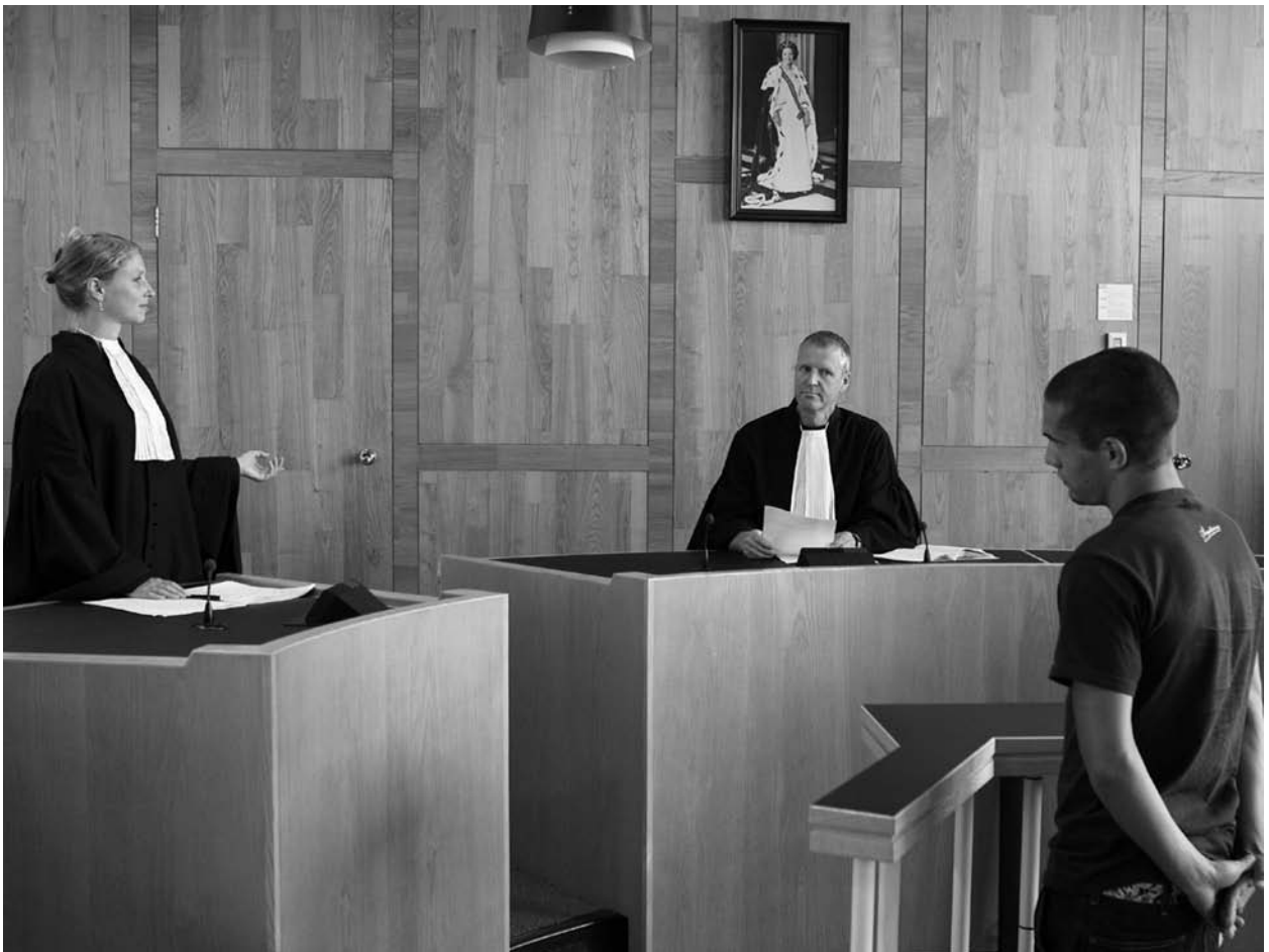
Jongeren weten weinig over rechtspraak en rechters

uitspraak van de rechter overeenkomsten heeft met datgene wat de leerlingen hebben beschreven. Voordat tijdens de laatste lessen een breder juridisch kader wordt aangeboden (onder andere door aandacht aan het civiele recht te besteden), komt een deskundige van het Openbaar Ministerie of uit de advocatuur met de leerlingen over het (straf)recht spreken.