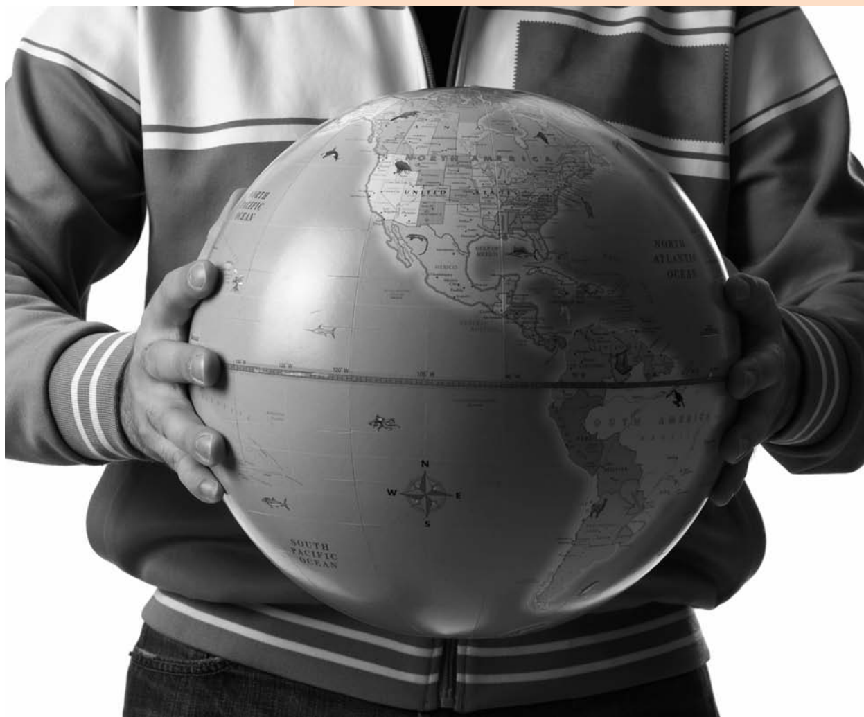
Burgerschap: hoe sta je in de wereld?

Lange tijd was het onderwijs erg persoonsgericht en individualiserend. Dat is de afgelopen jaren iets veranderd, onder andere door de aandacht voor het samenwerkende leren en leren in gemeenschappen. Daardoor komt het functioneren van mensen in groepen meer naar voren. De gekozen didactiek heeft gevolgen voor de burgerschapsvorming. Als je veel aandacht aan groepswerk besteedt dan kan dat gevolgen voor de sociale oriëntatie van de leerlingen hebben.'