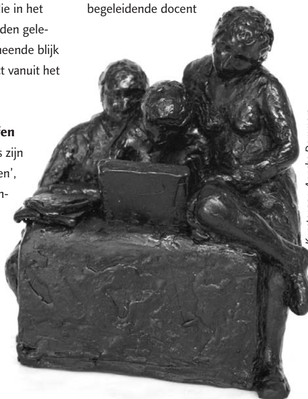
Kunstenaar: Anneke Dammers

De KNAW Onderwijsprijs is een prijs voor de beste profielwerkstukken van Nederland. Elk jaar winnen twaalf werkstukken (drie per profiel) de prijs. Geen kleinigheid: een winnend werkstuk levert de leerlingen een jaar gratis studeren op, de school ontvangt een officiële plaquette en de begeleidende docent