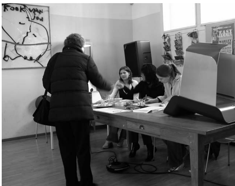
Burgerschap vraagt ondermeer om een actieve deelname aan de gemeenschap.

'Volgens mij zijn er vier voordelen. Ten