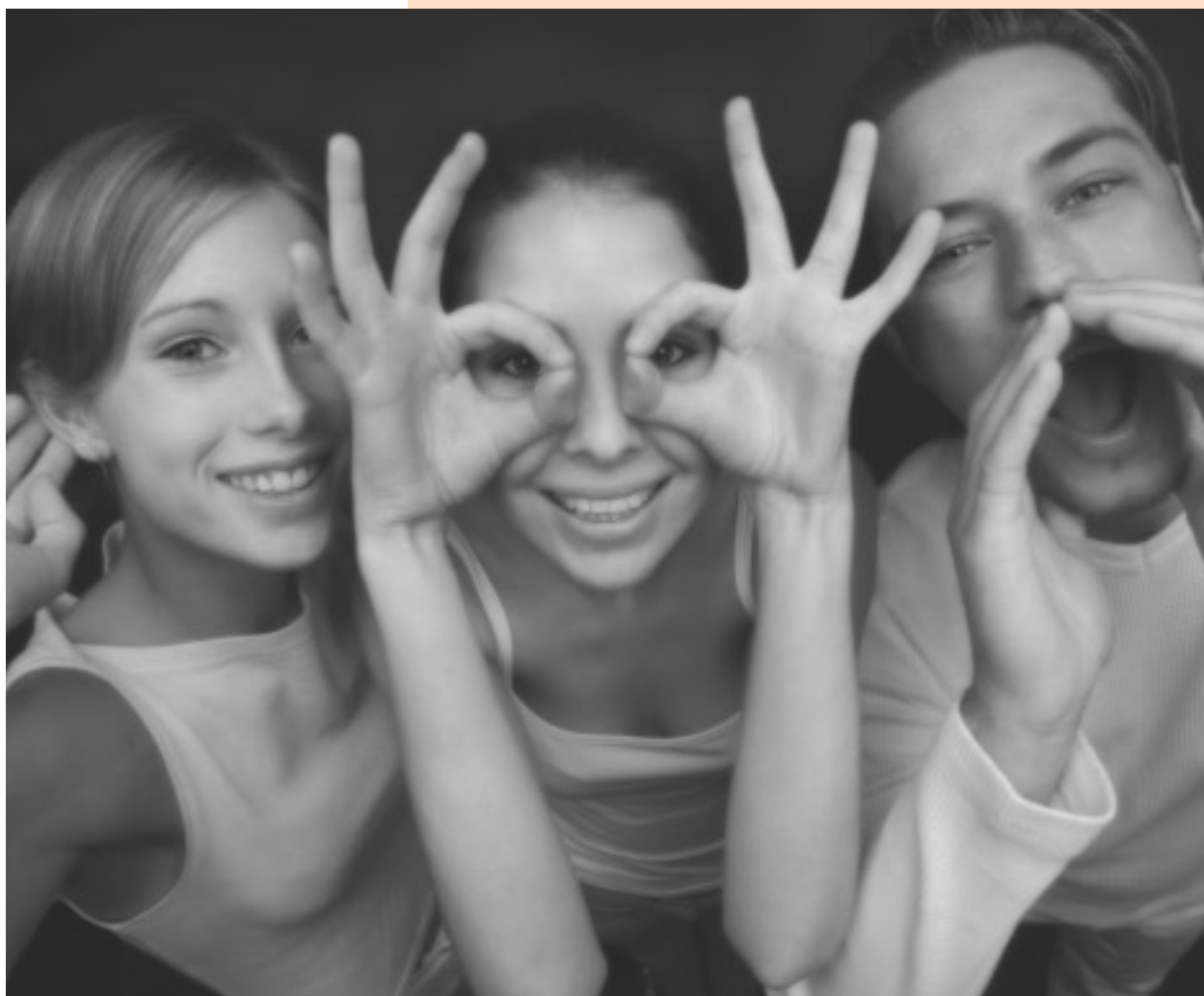
De betrokken burger wil worden geïnformeerd en gehoord en wil participeren.