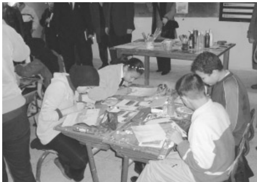
Nederlandse maatschappijleerdocenten op schoolbezoek in Marokko

de disco en op vrijdag meer en meer in de moskee; de hele week meisjes trachten te versieren en de hele week