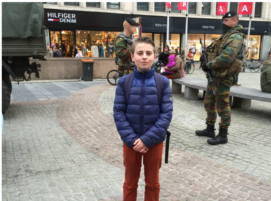
Soldaten in Europese straten, een nieuwe realiteit?

Stichting School en Veiligheid biedt de tweedaagse training Je hebt makkelijk praten voor docenten aan. Meer informatie en een overzicht van de trainingsdata vindt u op www.schoolveiligheid.nl/po-vo/makkelijk-praten .