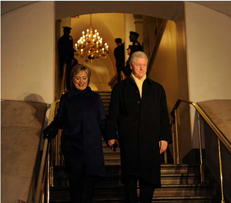
Hillary en Bill Clinton in het Capitool op weg naar de inauguratie van president Barack Obama

van geld en de invloed van boze, slechte krachten zoals Frank Underwood en zijn vrouw Claire dat laten zien. Insiders uit Washington nemen afstand van de serie omdat de serie het meest zwarte beeld van hun werk schetst. Het is een gearcheerde vorm van de werkelijkheid. Dat neemt niet weg dat elementen van de levens van de Clintons in het script een weg hebben gevonden, minus de moorden en het alleen maar uit zijn op de macht. Het punt is dat kiezers het beeld hebben gekregen van de Clintons als power hungry politici. Dat snap ik ook goed. De Clintons hebben veel gedaan om de macht te behouden, of te verwerven toen het presidentschap van Bill ophield. Daar gaan zij ver in. Ze hebben een machine opgebouwd, een rolodex, een contactennetwerk dat zijn weerga niet kent. Als je iets lulligs over de Clintons zegt, dan word je er keihard uit geflikkerd. Als je een hielenlikker bent en ze naar hun mond praat, dan blijf je meedraaien. Dat heeft vrij heftige vormen aangenomen. De Clintons haten journalisten. Hillary Clinton geeft niet voor niets bijna geen interviews aan journalisten. In april 2015 maakte ze bekend dat ze voor het presidentschap ging en heeft ze een jaar lang bijna geen interviews gegeven. Er stonden geen interviews in The New York Times of The Washington Post . Aan de andere kant staat Donald