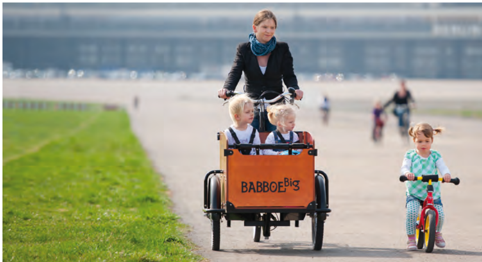
Een GroenLinks-kiezer met een bakfiets?