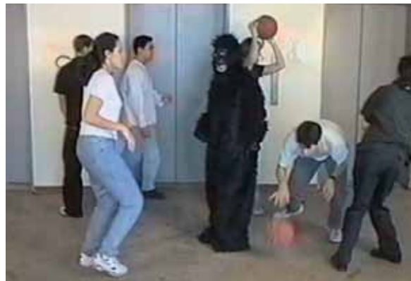
Selectieve waarneming

Een vervolgo opdracht toont het verschil tussen waarnemen en interpretatie. Ga met de klas naar buiten en laat de leerlingen een kort objectief verslag schrijven over wat ze zien. Het kan heel klein zijn, een man die een zak in de container deponert.