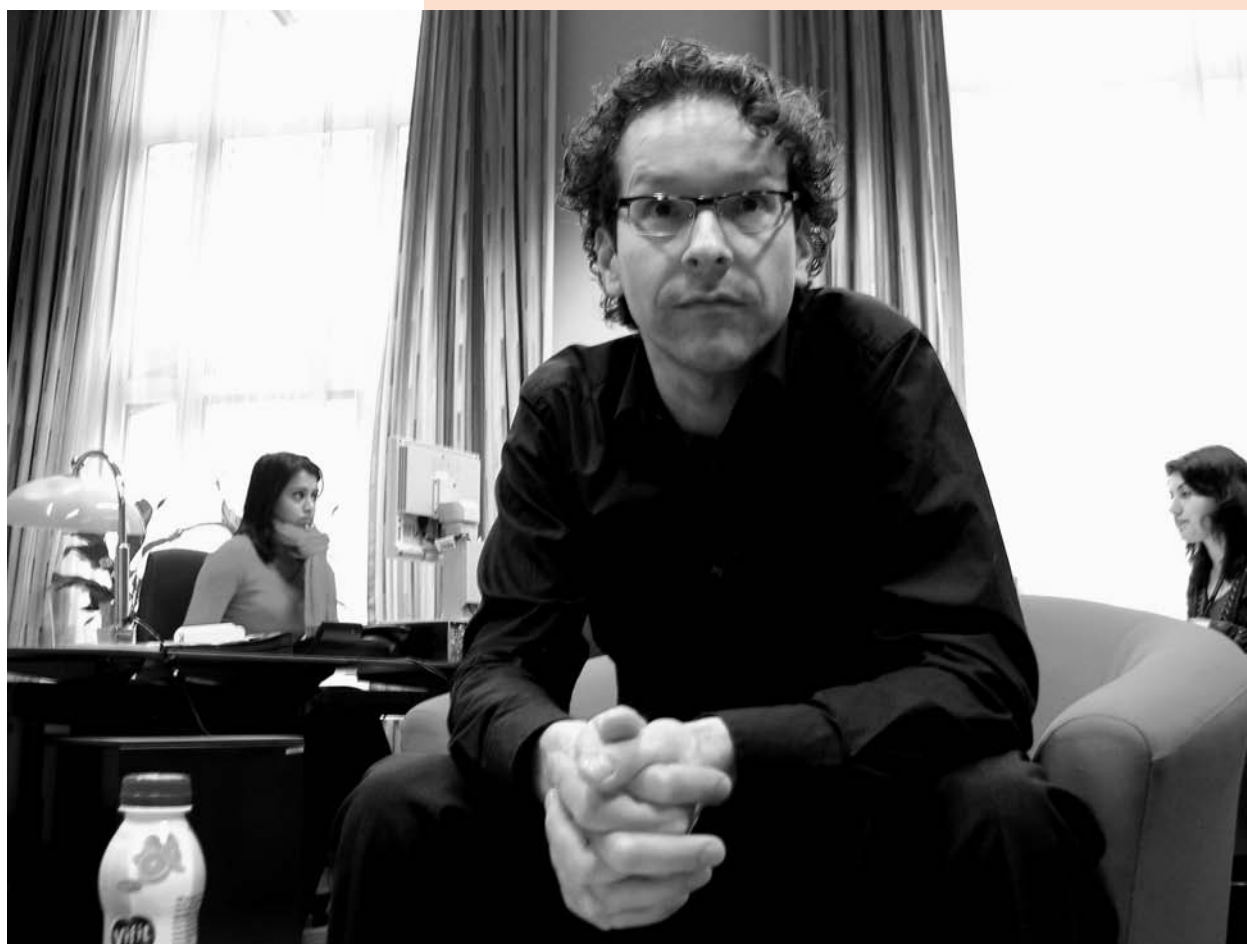
Commissievoorzitter Jeroen Dijsselbloem

We zijn geschrokken van pabo's waar studenten niet alleen hun eigen leerdoelen moesten formuleren, maar ook nog eens de manier waarop ze daar moesten komen! Zelfstandigheid heeft ook haar grenzen. Ze zitten niet voor