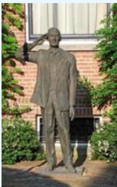
Pim Fortuyn, LPF

Veel vmbo-leerlingen (vooral op bb- en kb-niveau) hebben het moeilijk met het begrijpen van verkiezingsuitslagen en zetelverdelingen. Rijen met cijfertjes en tabellen vinden zij lastig. Start een gesprek dan ook met de onderstaande afbeelding en laat de communicerende vaten zien. In de afbeelding is duidelijk te zien dat als de aanhang van de traditionele partijen slinkt, de populistische partijen en de proteststemmers juist in omvang toenemen en vice versa. Kiezers schuiven bijna altijd binnen hun linkse of rechtse kamp: bijvoorbeeld tussen PvdA en SP en tussen VVD en PVV. Geef het voorbeeld van Iphone-4-gebruikers; die stappen niet opeens over naar Samsung, maar kopen een nieuwere aantrekkelijkere Iphone: de 5! Om een discussie of een les over populisme te structureren kunnen de vraagpunten op de volgende pagina worden gebruikt. Belangrijk is om als docent telkens flink