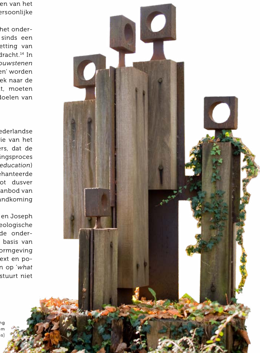
Een individu ontwikkelt zich het meest in de omgeving waarmee hij direct interacteert: het microsysteem (foto: Het gezin van Ubbo Scheffer, Wikimedia Commons)

Deze conclusies problematiseren de bevindingen van de Nederlandse Inspectie voor het Onderwijs tot dusver. Hierbij moet de kanttekening worden gemaakt dat de Amerikaanse en Nederlandse onderwijssystemen van elkaar verschillen, waardoor de onderzoeksresultaten logischerwijs ook van elkaar zullen verschillen. Echter, met haar nadrukkelijke beschrijving van de huidige burgerschapspraktijken lijkt de inspectie voorbij te gaan aan de vormgeving en de invloed van de schoolomgeving daarop. Niet de interacties tussen vormgevers en omgevingsactoren, maar de resultaten van de vormgeving staan centraal. Met de focus op deze interacties kunnen Amerikaanse onderzoekers ook een analyse en typering van de vormgeving geven en kunnen dilemma's in de vormgeving worden gesignaleerd.