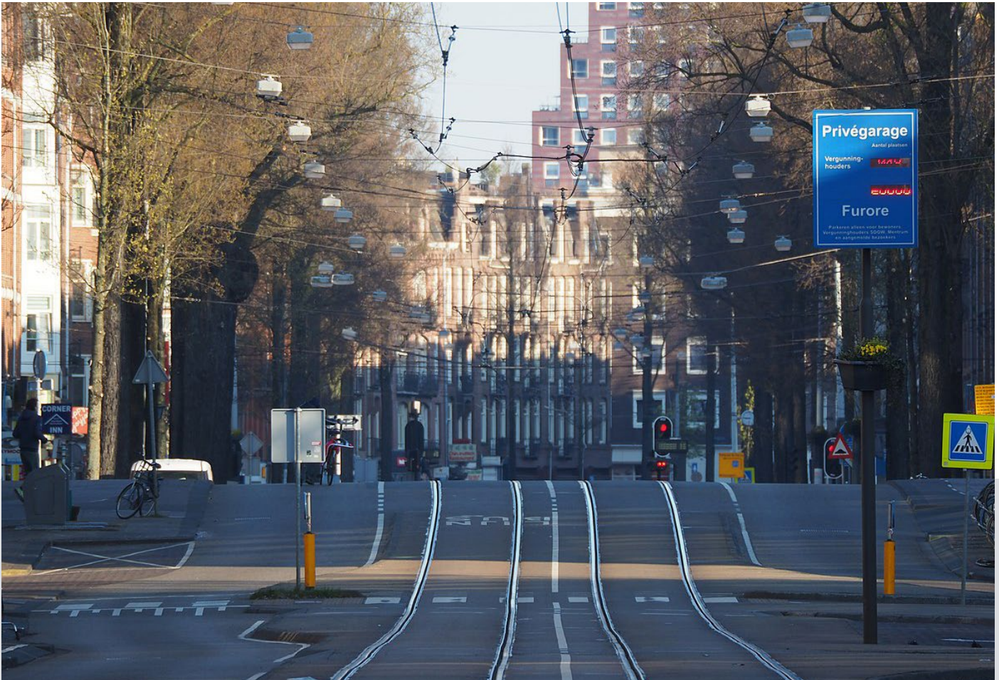
De relatie tussen het individu en de gemeenschap anno mei 2020: 'Blijf binnen!'

waarin hij of zij leeft in het concept wordt betrokken. In dit verband is het maatschappelijk middenveld een belangrijke context en de betrokkenheid van burgers bij maatschappelijke organisaties onmisbaar.