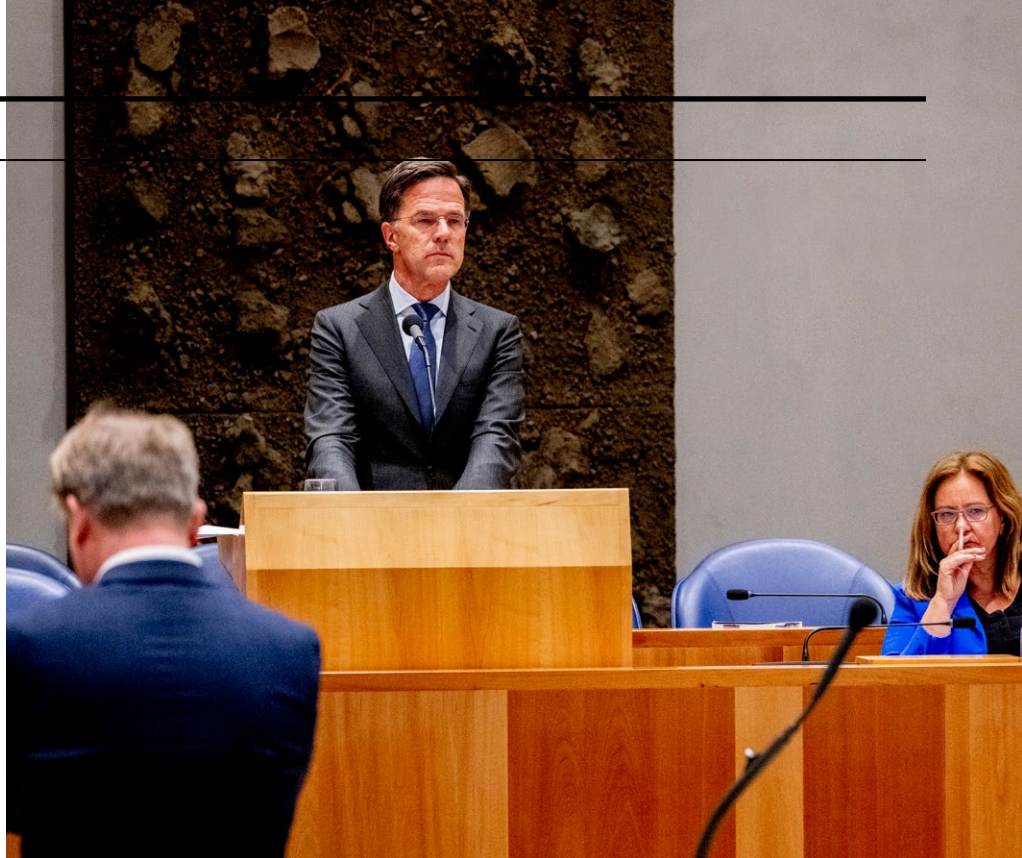
'Er is een Rutte-doctrine-2 in de maak.'

'De laatste jaren gebeurt dit zelfs vrij veel. Kennis hebben van wil niet direct zeggen naleven van . Er wordt naar geitenpaadjes gezocht. Daarom schreef ik dit boek. Af en toe wordt ervan uitgegaan, zoals bij de benoeming van staatssecretarissen in een demissionair kabinet, dat niemand toch precies weet hoe het zit. Ik durf dit arrogantie te noemen. Bestuurlijke arrogantie in de omgang met de Grondwet. Er wordt machtspolitiek bedreven. Dat is slecht, want hiervan erodeert ons grondwettelijke bestel. De spelregels zijn er en iedereen moet er op een gelijk